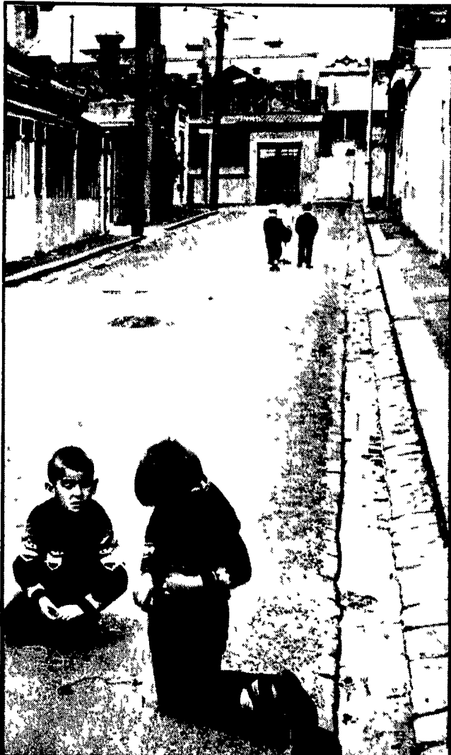
Il desolato aspetto di un quartiere periferico di Sidney dove vivono molte famiglie di Italiani emigrati.