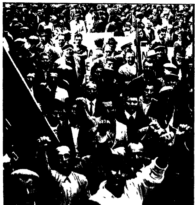
L'immagine di una recente manifestazione di braccianti in sciopero per il rinnovo del contratto di lavoro

Scioperi e assemblee zonali e aziendali in provincia di Ravenna, Piacenza e Rovigo — A Lamezia Terme assieme ai braccianti sono scese in sciopero tutte le categorie dell'industria — Giovedì alla Camera inizia il dibattito su mezzadria e colonia