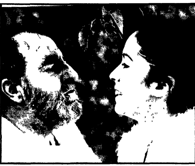
Il cast del film « Racconti di Canterbury », diretto da Pier Paolo Pasolini, sta prendendo forma man mano che il regista porta avanti la lavorazione.