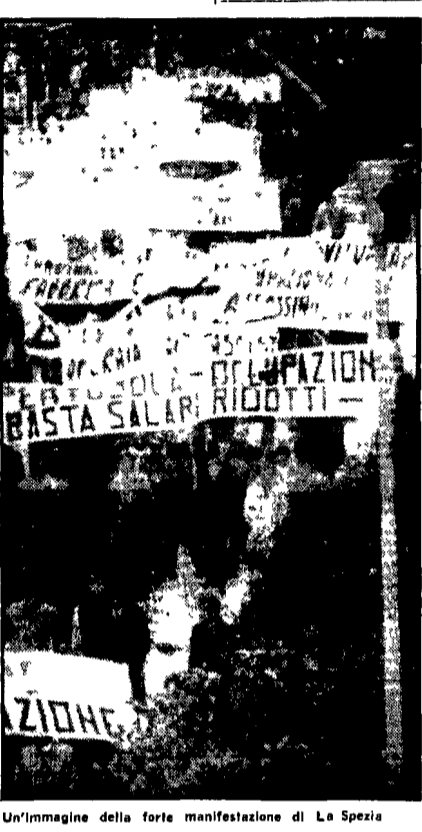
Un'immagine della forte manifestazione di La Spezia