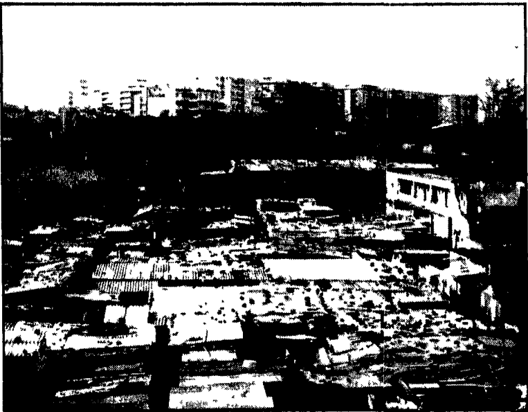
Ecco un'immagine delle baracche che al Trovato e Pietralata, decine di famiglie sono costrette a vivere. E' una situazione che va sanata, la richiesta di requisizione degli appartamenti sfitti è la strada vera che può portare ad eliminare questa autentica vergogna.

Discussa in una riunione di Giunta la richiesta del PCI e dell'UNIA - Vanno requisite anzitutto le case abusive della Magliana - Estendere il blocco degli sfratti per sei mesi - Domani riunione per l'autorizzazione degli affitti