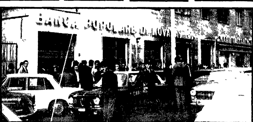
L'agenzia della Banca Popolare di Novara dove è stata compiuta la rapina, nell'foto in alto da sinistra a destra l'impiegato della banca colpito alla testa, uno degli autisti del camion e il direttore e un'impiegata dell'ufficio postale rapinato