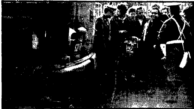
L'opacimetro, lo strumento che misura la capacità di inquinamento degli automezzi, in funzione ieri mattina durante i posti di blocco disposti dal pretore.

Anche ieri hanno funzionato gli opacimetri - Un fatto positivo ma che non basta a risolvere il problema - Le gallerie i punti neri dell'inquinamento