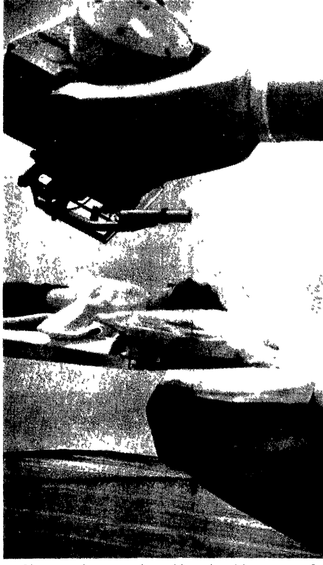
Il «Rokus» è una modernissima apparecchiatura radiologica realizzata dagli scienziati sovietici. È attualmente in funzione presso l'ospedale «S. Botkin» di Mosca.

La legge varata nel '70 - I poteri della «stazione epidemiologica» che controlla inquinamenti e ambienti di lavoro. Nel poliklinico, centro di organizzazione dei servizi medici di un quartiere, di una zona rurale o di una fabbrica