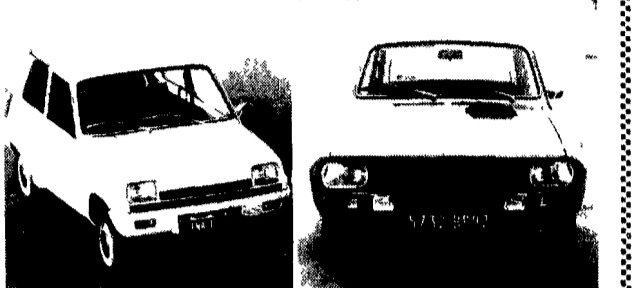
La Renault «5» e la Renault «12» Gordini

La vetturina proposta con due motori di diversa cilindrata - Costerà in Francia sui 10.000 franchi - Le prestazioni della «R 12 Gordini»