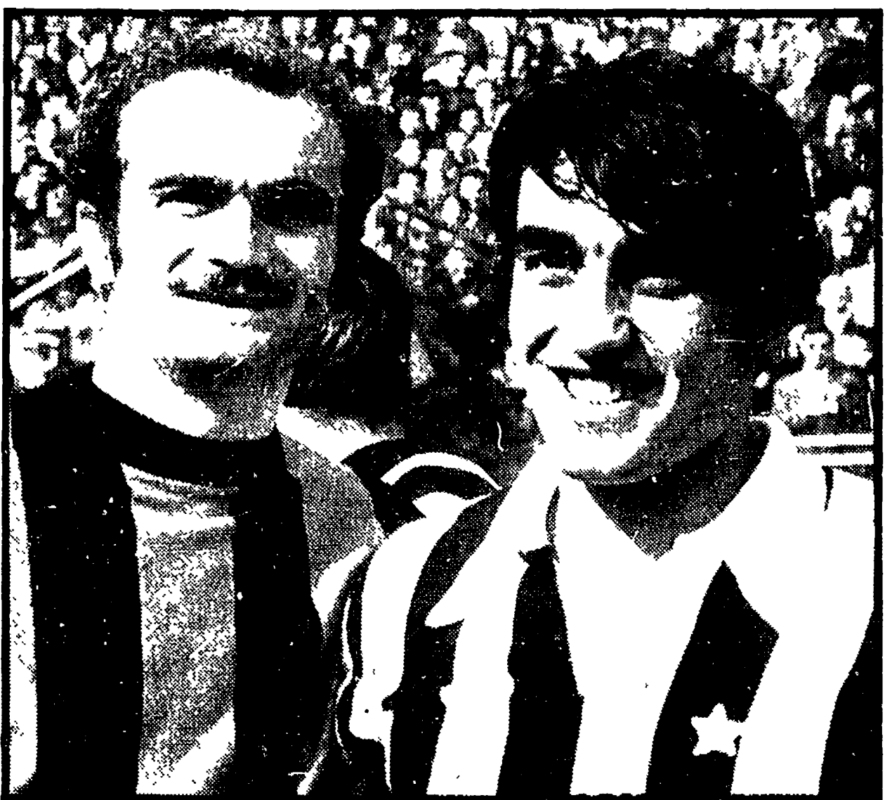
MAZZOLA ed ANASTASI, i due primi attori di Inter-Juve, il primo big match del 1972

Un campione del ciclismo degli «anni venti»