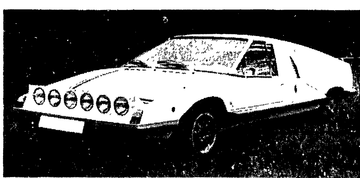
Il prototipo della «S 110 GT» con i fari in posizione di funzionamento.

La Skoda sta decisamente guardando al futuro. Dopo aver messo in produzione il 110 E, è in corso la progettazione di una vettura dalla linea decisamente occidentale che viene venuta in Italia dalla Motored al prezzo competitivo di lire 1.100.000. La Casa cecoslovacca ha ora presentato un interessante prototipo di vettura sportiva, contraddistinta dalla sigla «S 110 GT». La sua meccanica e impostazione stilistica è il frutto della stretta collaborazione tra i tecnici della Skoda e gli studenti in ingegneria della Università di Praga; è nata così una vettura sportiva in cui i tecnici hanno guidato molto favorevolmente; proprio questa positiva accoglienza potrebbe indurre i dirigenti cecoslovacchi a programmare per un prossimo futuro una produzione in piccola serie della «S 110 GT».