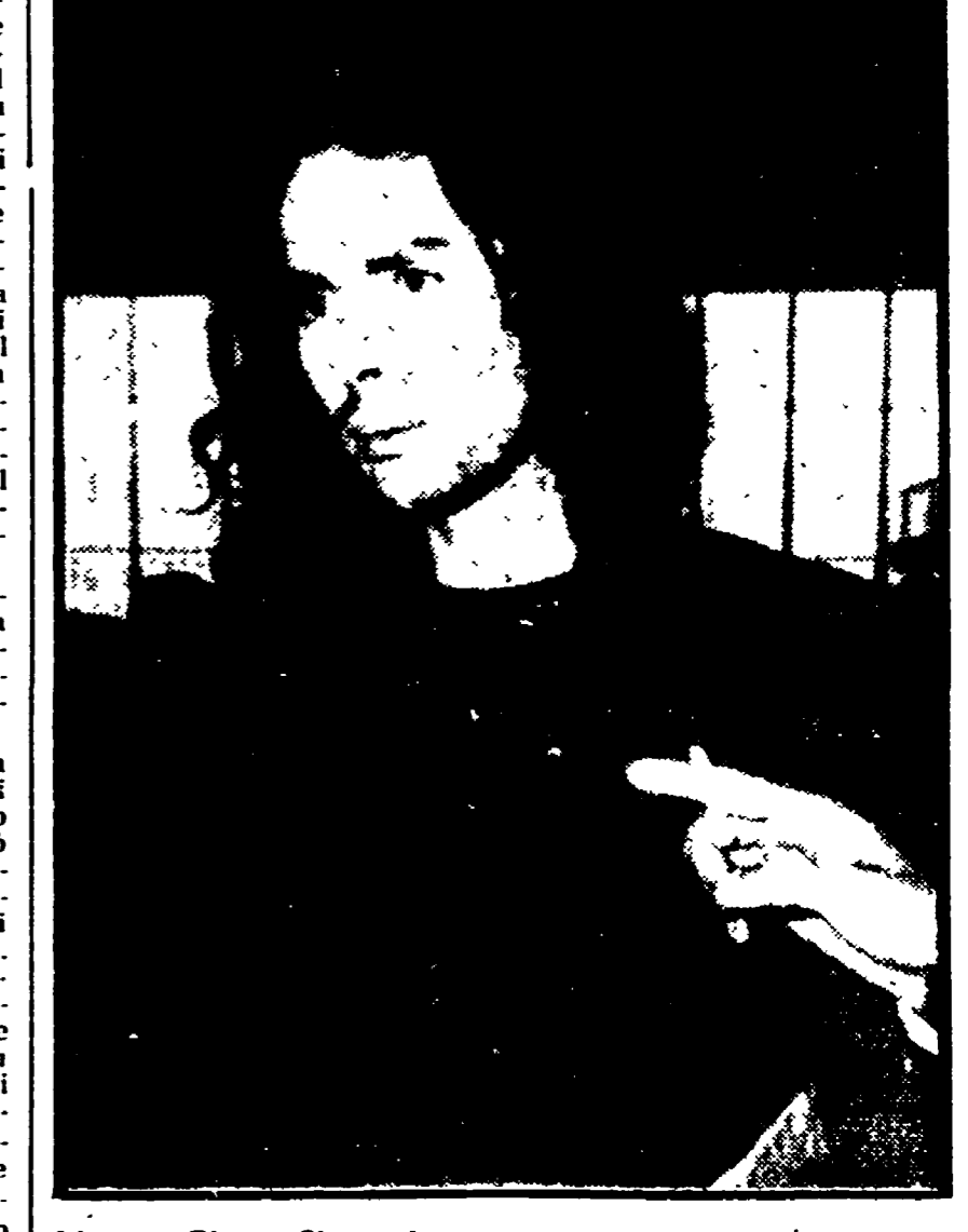
L'attore Pierre Clementi

Nel loro appartamento sarebbero stati rinvenuti pochi grammi di cocaina e LSD