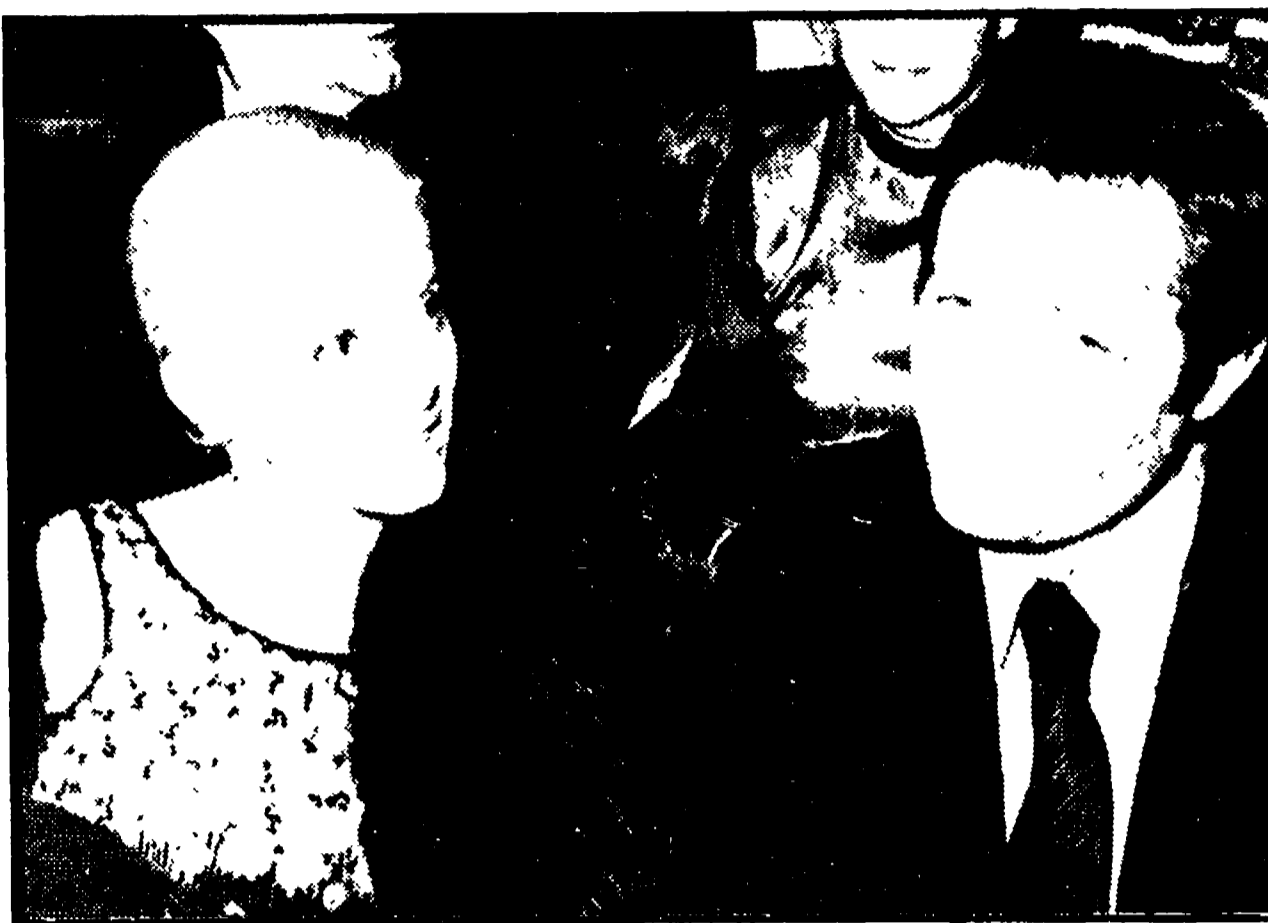
PARIGI — Marcello Mastroianni ha raggiunto a Parigi Catherine Deneuve per doppiare, con lei, il film «La cagna» di Ferreri...