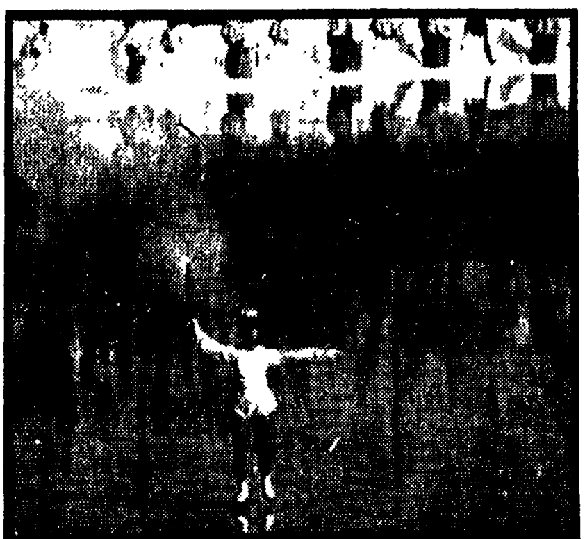
Gli ultimi metri del percorso della fiamma olimpica. Una pattinatrice porta la fiamma nello stadio (a sinistra). Un atleta la porta su per le scale (al centro) fino al tripode. A destra: un momento della cerimonia finale

L'austriaco SCHRANZ, fine di consolari della squalifica e andato al patrone come si vede palese di piede e di testa con una certa disinvoltura. Che abbia trovato un nuovo sport adatto per lui?