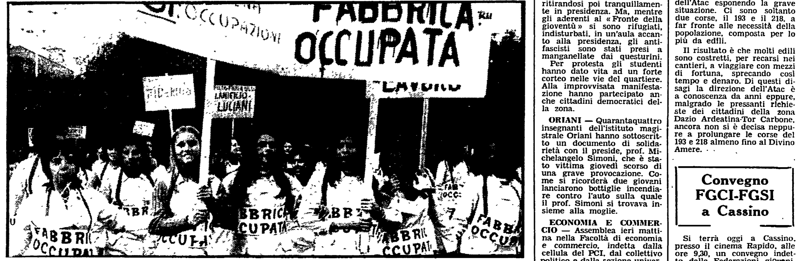
Le ragazze della Cagli durante una manifestazione assieme alle operaie di altre fabbriche occupate

Le decisioni del consiglio di fabbrica dopo la rottura delle trattative - Una maggiore articolazione degli scioperi e iniziative cittadine - In agitazione i dipendenti della regione - Mercoledì a Pomezia riunione delle aziende Montedison della provincia