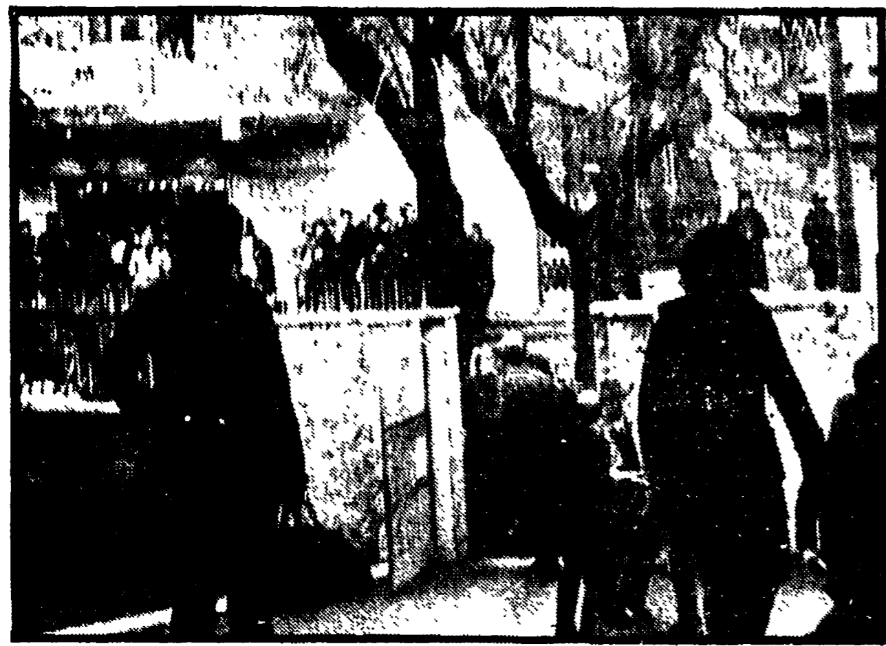
L'istituto Fermi presidato, nei giorni scorsi, dalla polizia

Selezione classista e incertezza degli sbocchi professionali costituiscono un altro grave elemento di crisi - Indicati cinque obiettivi di lotta - Stamane assemblea all'istituto « Enrico Fermi »