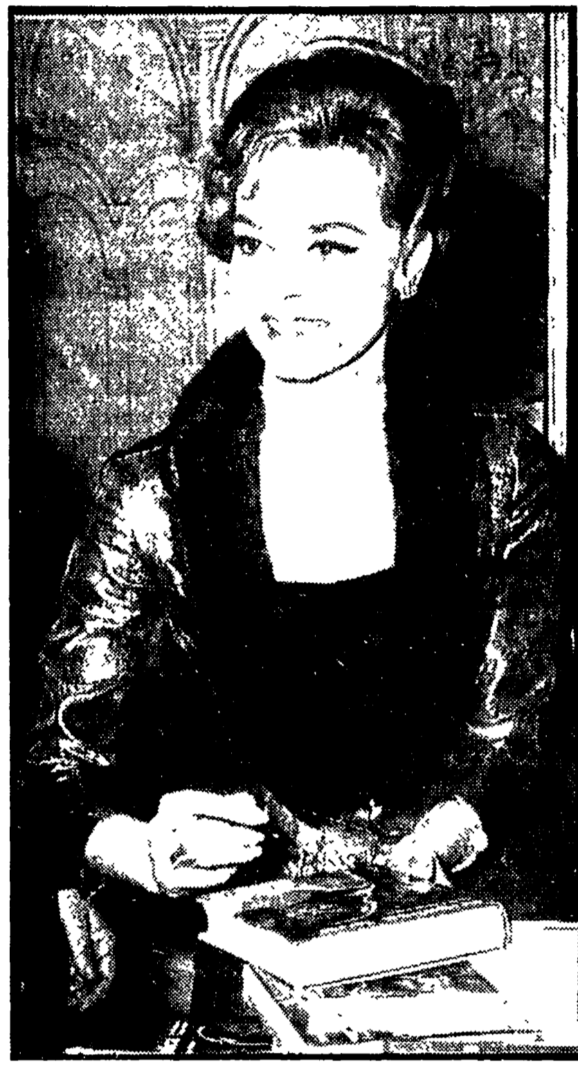
PARIGI — Michele Mercier (nella foto) è in partenza per la Norvegia, dove, a trentacinque gradi sotto zero, interpreterà, accanto a Charlton Heston, una nuova versione cinematografica del "Richiamo della foresta" di Jack London, che questa volta sarà diretta dal regista Ken Annakin. Nel film l'attrice Daré vita al personaggio di una cantante francese, la quale, emigrata in Alaska, apre un hotel in un piccolo villaggio di cercatori d'oro.