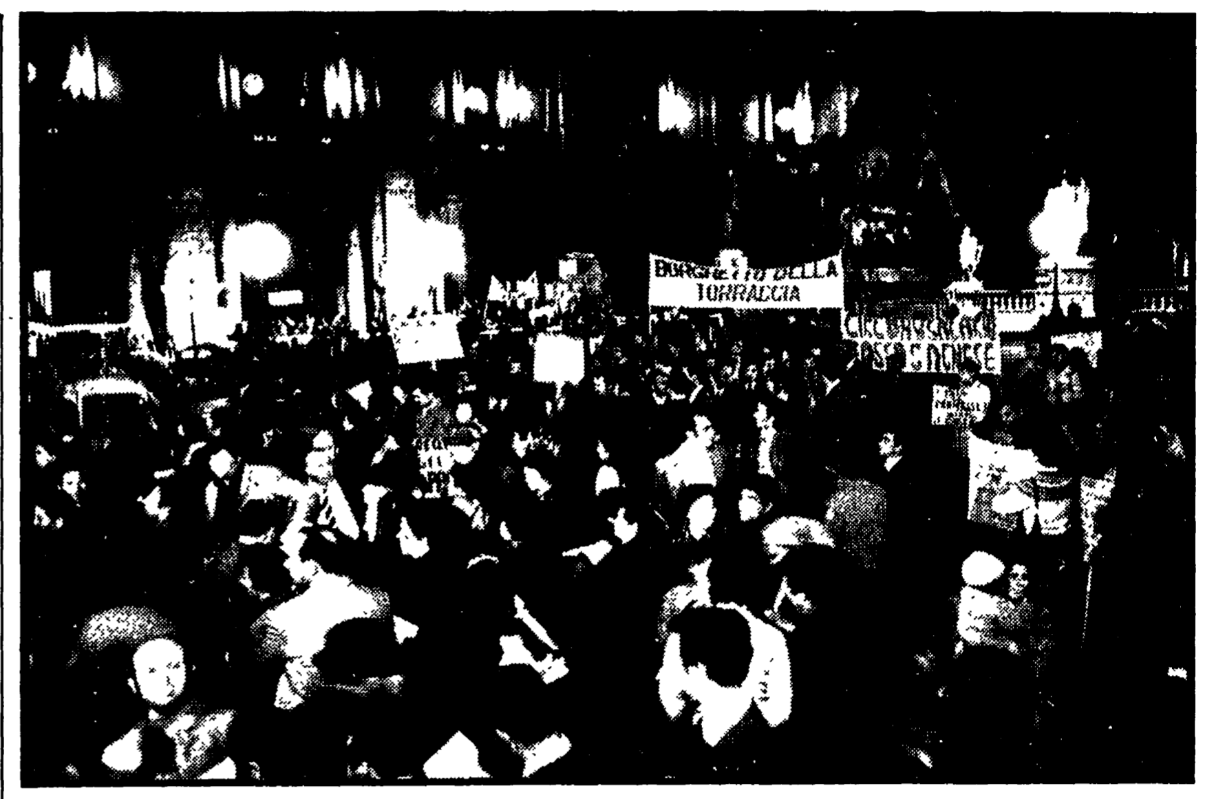
Centinaia di senzatetto hanno manifestato a lungo sulla piazza del Campidoglio