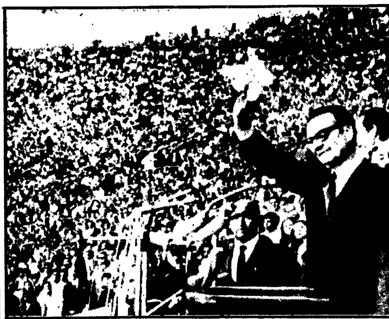
SANTIAGO DEL CILE - Una recente manifestazione popolare attorno ad Allende e al suo governo