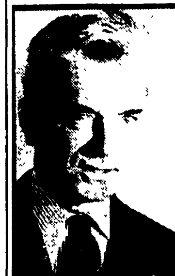
Herbert von Karajan

10.00 Programma cinematografico (Per la sola zona di Roma). 21.00 Telegiornale 21.15 Il mondo senza sole Film. Regia di Jacques-Yves Cousteau. Questo documentario realizzato nel '56 dal comandante Cousteau ottiene numerosi premi, tra cui un Oscar d'oro a Cannes. Il lungometraggio mostra per la prima volta suggestive immagini sulla fauna degli abissi del Mar Rosso e un utopistico tentativo di comunità umana sottomarina». Cousteau ha portato a termine almeno ventisei film su questi argomenti e i telespettatori lo ricorderanno per il suo programma televisivo «L'uomo e il mare».