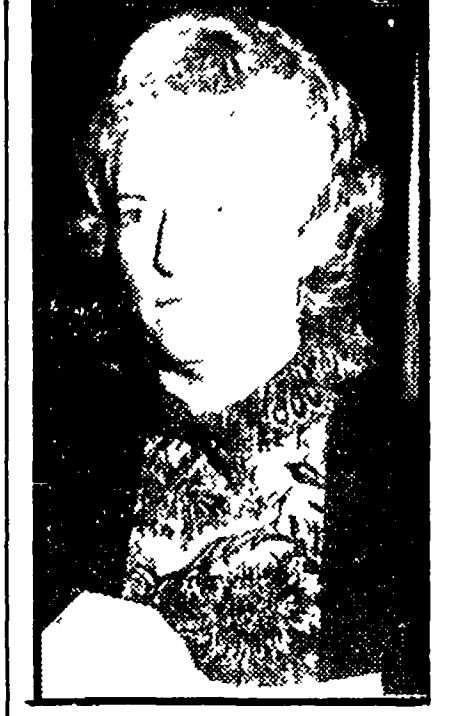
La sposa di Kappler

Herbert Kappler, l'ex tenente colonnello delle SS che sta scontando l'ergastolo come principale responsabile del massacro delle Fosse Ardeatine, si è sposato - ieri mattina - nel penitenziario militare di Gaeta.