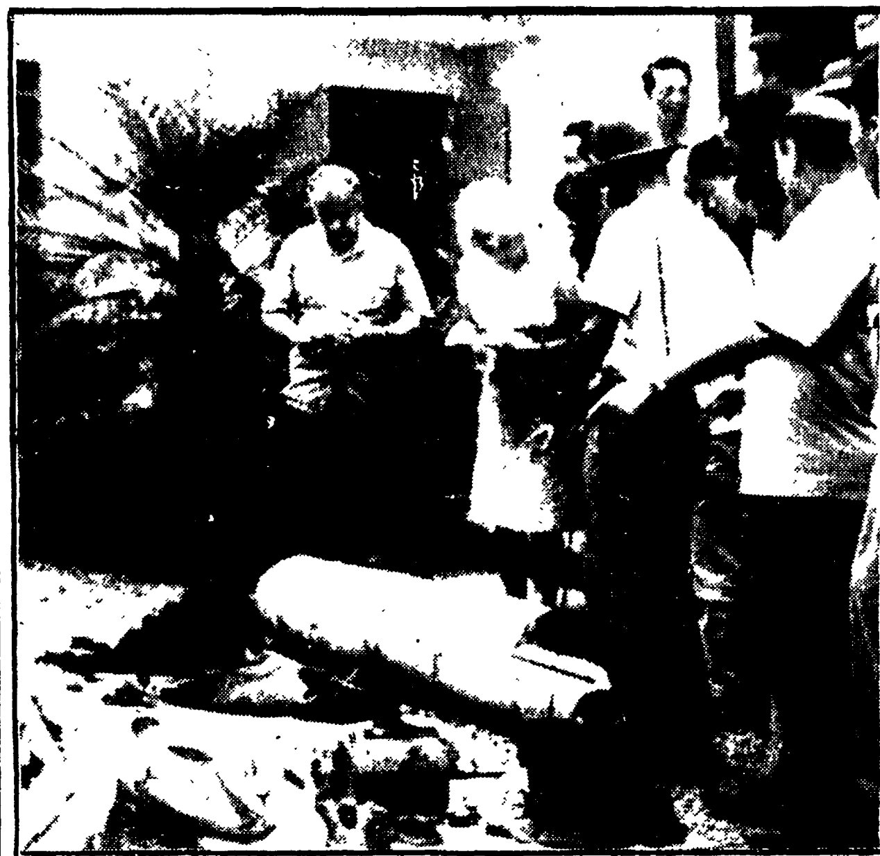
HAIPHONG - Le incursioni americane su Haiphong sono costate la vita a 244 persone. Membri del corpo diplomatico accreditati ad Hanoi hanno visitato la città, dopo i bombardamenti. Nella telefoto: una bomba anti-uomo, inesplosa, viene mostrata ai diplomatici

Seconde notizie di fonte americana, la settimana scorsa è stato rafforzato questo sistema con altri 4.000 uomini. Voli insistenti dicono inoltre che « marines » americani in tenuta da combattimento mimetica, senza alcun segno esteriore che li indichi come appartenenti all'esercito americano e senza distintivi di grado, sono già sbarcati a nord di Huế per rimpolpare le forze di Saigon, che non danno alcuna garanzia di poter resistere ad eventuali nuovi attacchi.