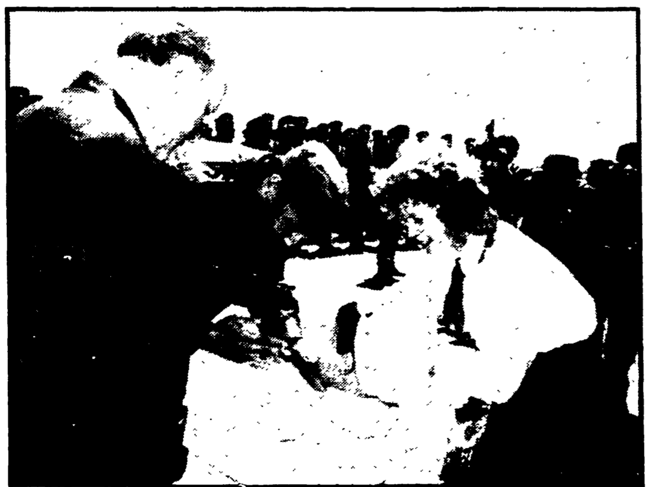
Nella foto: l'arrivo di Fidel Castro; a pioniere dà il benvenuto all'ospite cubano. Di spalle il compagno Kadar