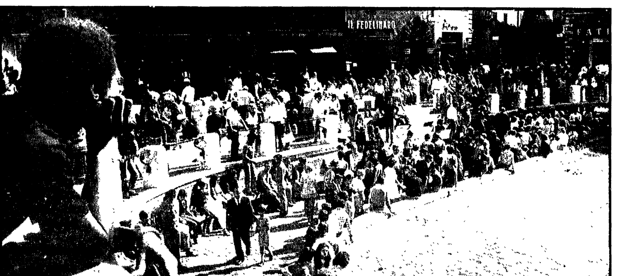
Folla di turisti e di romani (non tutti hanno potuto fare il « ponte ») a fontana di Trevi

Mobilizzata la polizia stradale - Finora pochi e senza gravi conseguenze gli incidenti stradali - Una bimba di 10 anni muore in uno scontro sull'Aurelia - Secondo l'ufficio meteorologico il tempo tende a peggiorare