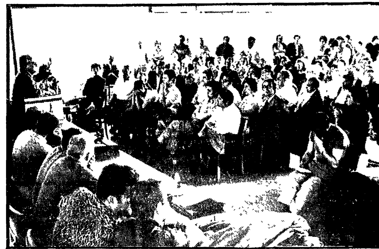
La manifestazione con Bufalini a Genzano

Il Partito è già al 101%; la FGCI al 100% - Il discorso del compagno Paolo Bufalini - Premiate le sezioni e i circoli che più si sono distinti nel tesseramento e nel reclutamento - Lanciata la campagna per la stampa comunista