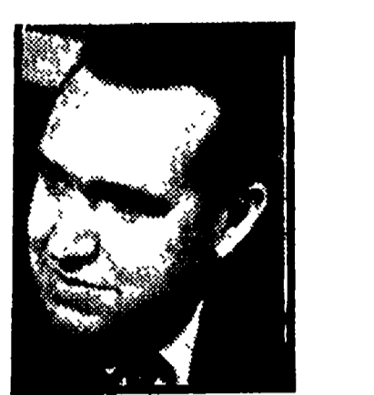
DIANA - La Confindustria sfida tutti i lavoratori

La risposta al grande padronato industriale (privato e pubblico) è a quello delle