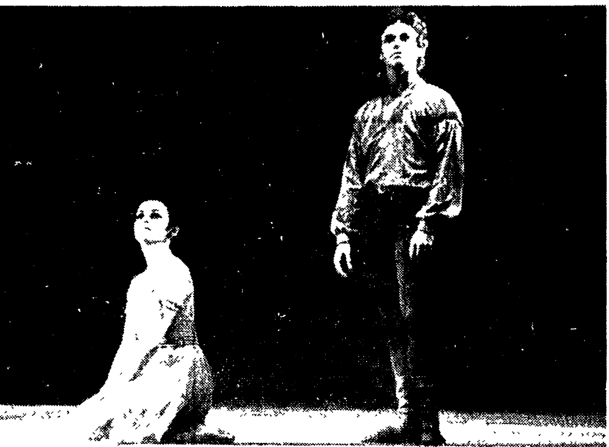
SPOLETO — I ballerini Lynn Seymour e Anthony Dowell in «Dances at a Gathering» di Jerome Robbins.