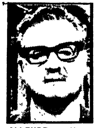
ALLENDE - Nessun passo indietro.