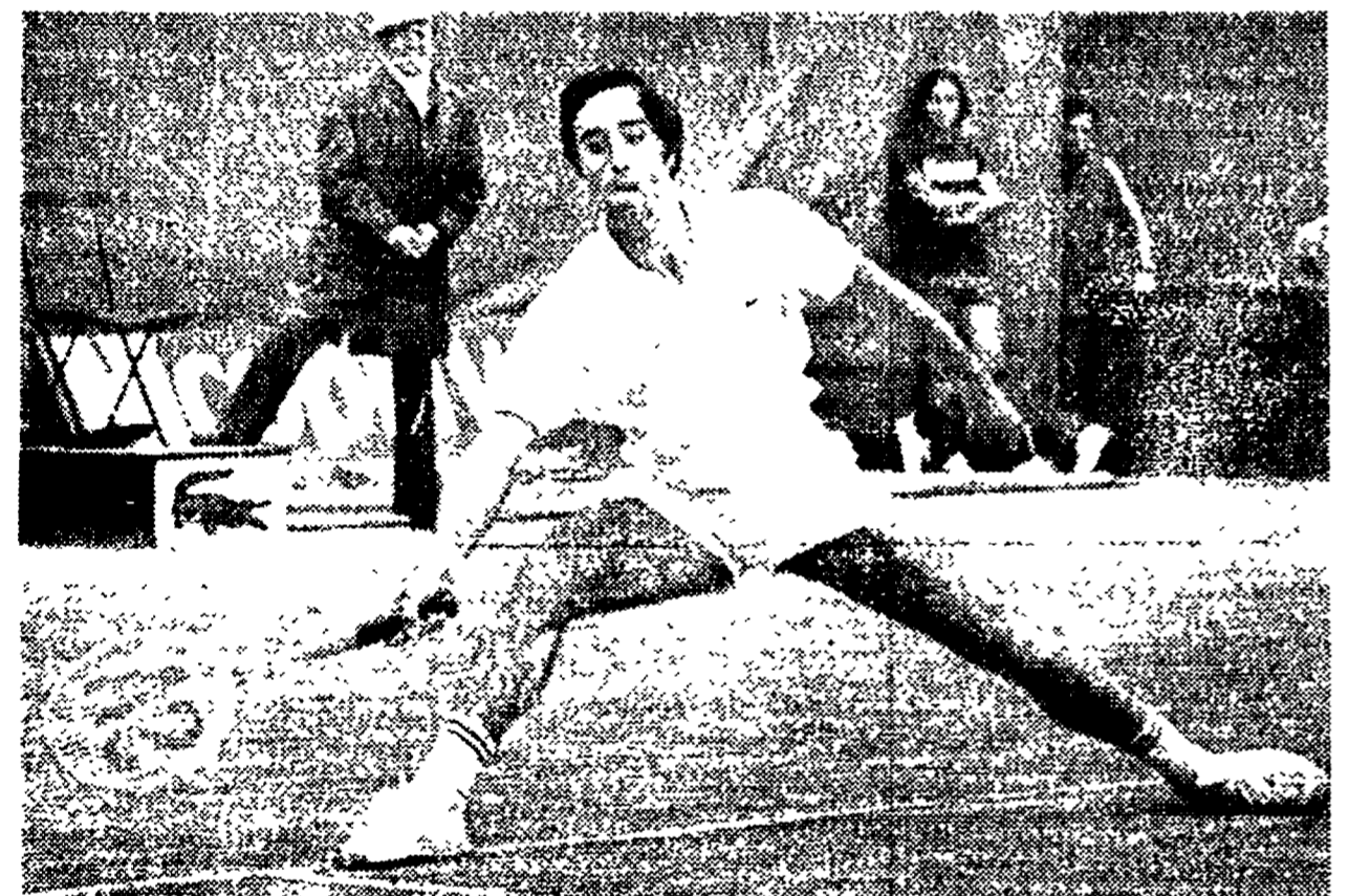
Alex Metreveli, il grande campione sovietico tenta di contrastare il romeno Ilie Nastase nella finale di zona « A » della Davis europea.

L'assurda ristrutturazione del torneo, su proposta italo-inglese - La sciagurata riammissione del Sudafrica