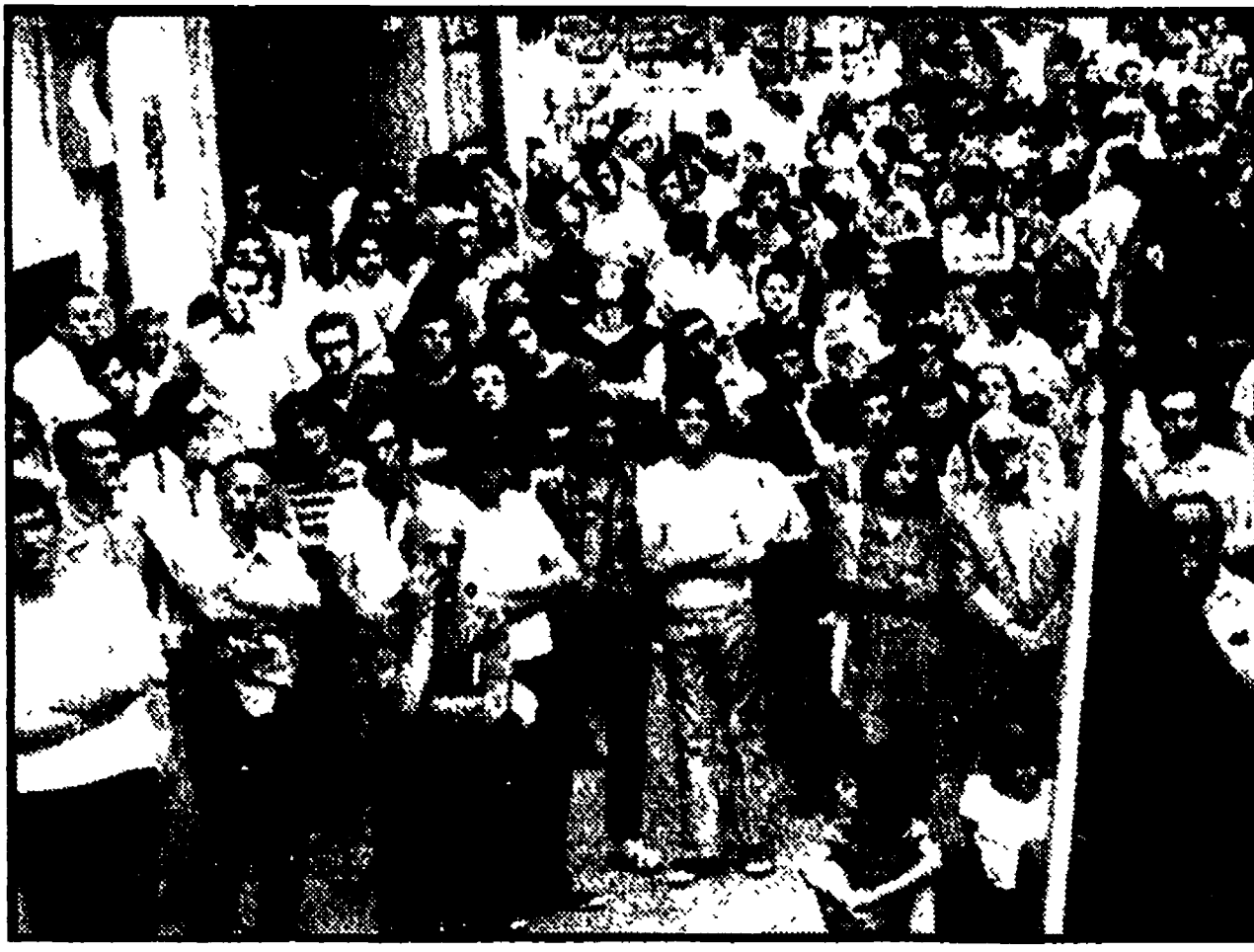
Due immagini della manifestazione unitaria che si è svolta ieri pomeriggio al Trionfale con l'adesione di PCI, PSI, PRI e ANPI