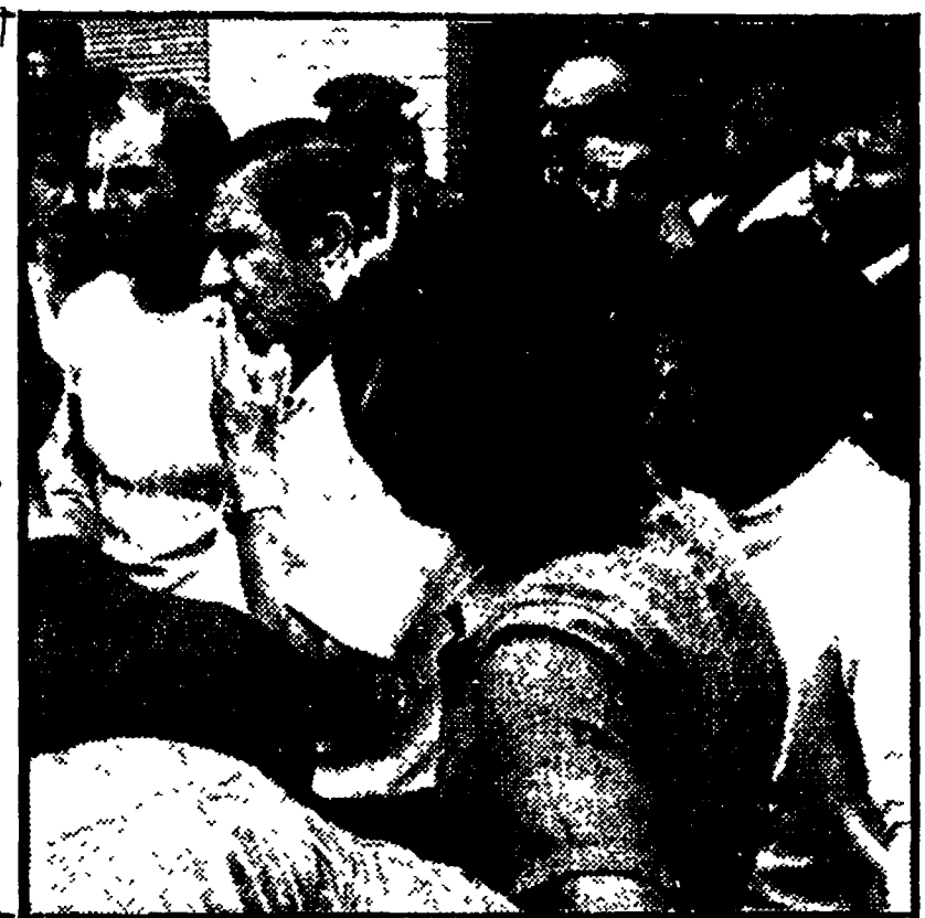
Gli inquilini sfrattati mentre, ieri, discutono con gli agenti

Ieri mattina è intervenuta la polizia ma l'UNIA ha ottenuto una proroga di nove giorni - Un padrone «fantasma» che non vuole trattare