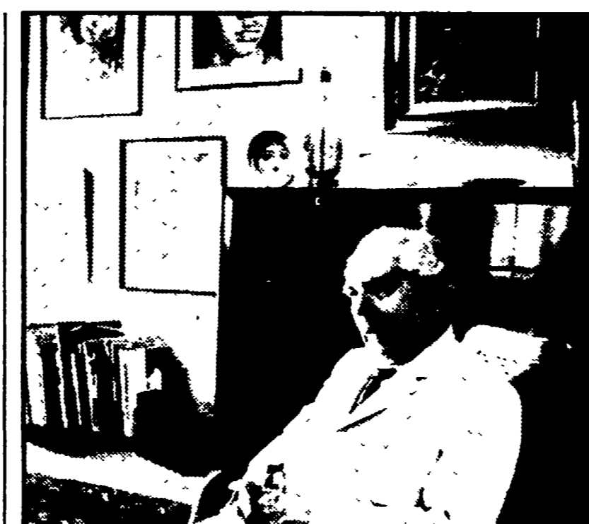
Juan Marinello nella sua casa dell'Avana

L'AVANA, luglio. Mi accoglie nella porta di casa con un sorriso affabile Juan Marinello: 73 anni, ambasciatore di Cuba presso l'UNESCO, ex rettore dell'Università dell'Avana, membro del Comitato Centrale del Partito comunista, sagacia tra i più notevoli di lingua spagnola, mezzo secolo di vita politica e di intensa attività intellettuale a Cuba e in America Latina.