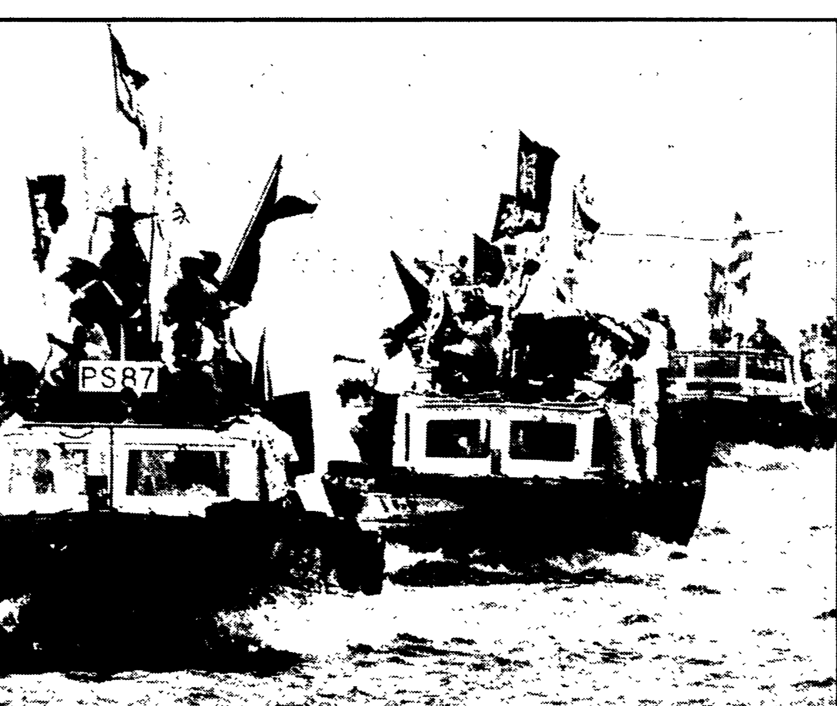
TOKYO - Da più di tre mesi 160 mila marinai giapponesi sono in sciopero. Chiedono aumenti di salario e la riduzione dell'orario di lavoro. Ecco una delle manifestazioni che si sono svolte in diversi centri portuali del paese per costringere le compagnie marittime a recedere dalla loro intransigenza