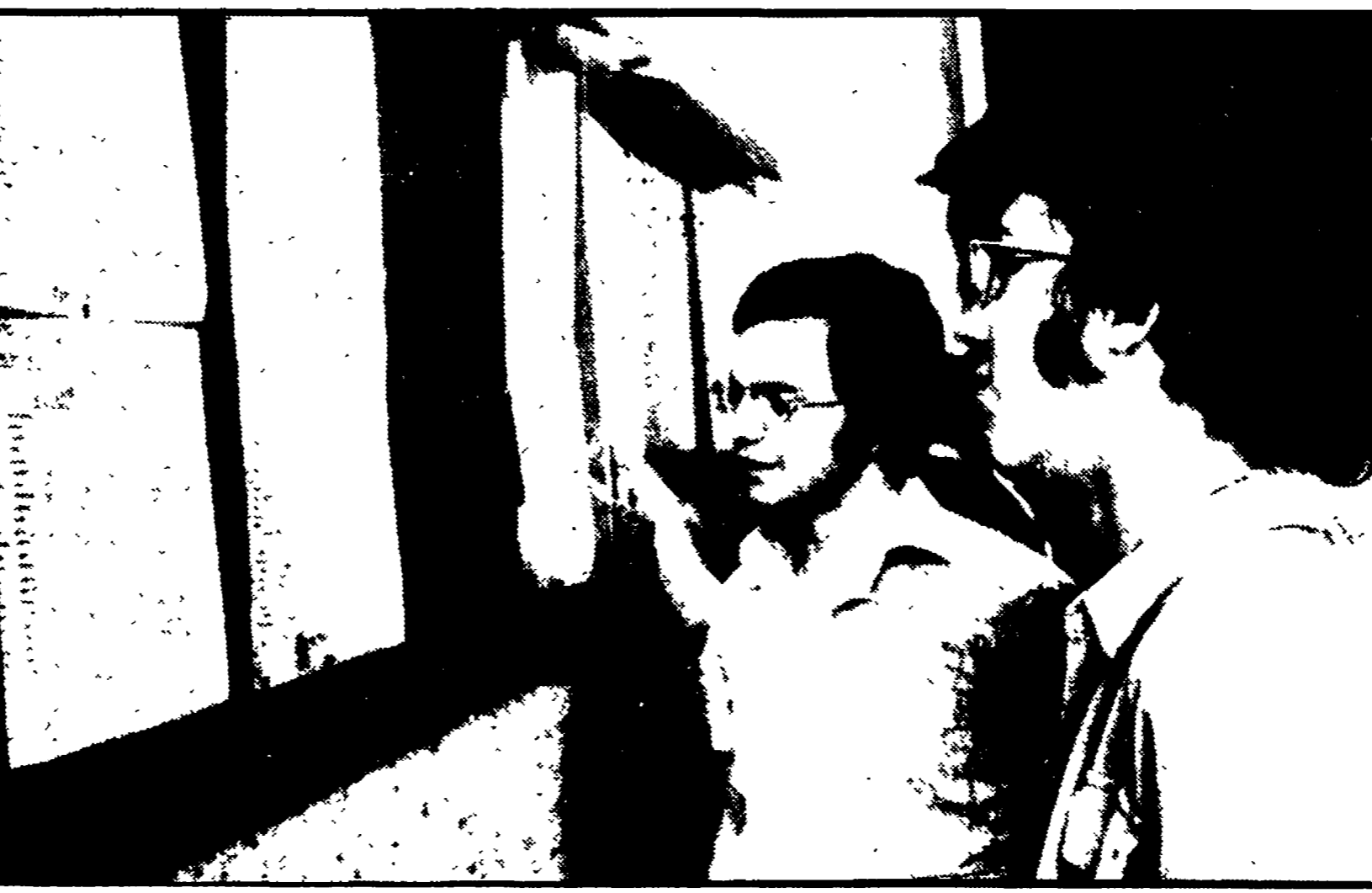
Studenti osservano i «quadri» affissi in una scuola con i risultati della maturità