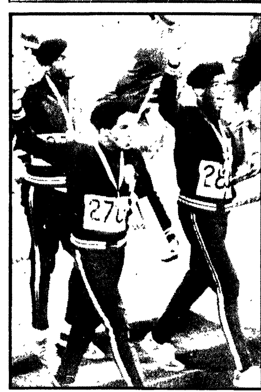
Da Londra ad Helsinki, Melbourne, Roma, Tokio, Città del Messico: