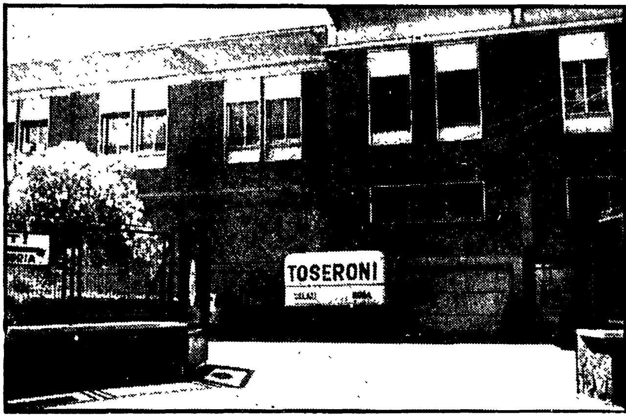
L'ingresso della fabbrica di gelati «disinquinata»