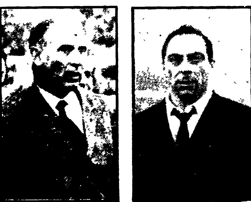
Le squadre sono ancora in ritiro; i calciatori sono ancora sotto tiro per smaltire l'inevitabile aumento di peso dovuto agli ozii estivi e già saltano fuori le prime «bombe» di una stagione che si annuncia particolarmente movimentata.