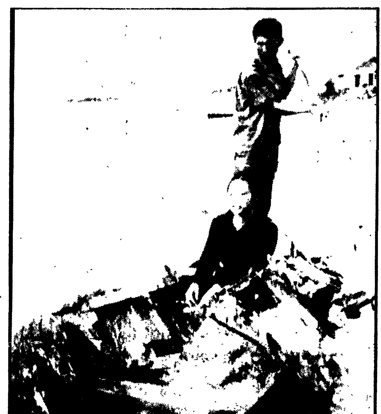
Le forze popolari all'attacco

Il proprietario della società Appia, fatta chiudere dalle autorità sanitarie, ha parlato nel corso di una conferenza stampa di completo. Minacciato il posto di lavoro di 2.200 dipendenti i comunisti hanno chiesto al governo un immediato intervento a tutela della salute pubblica e per sottrarre alla speculazione privata le riserve idriche del Paese