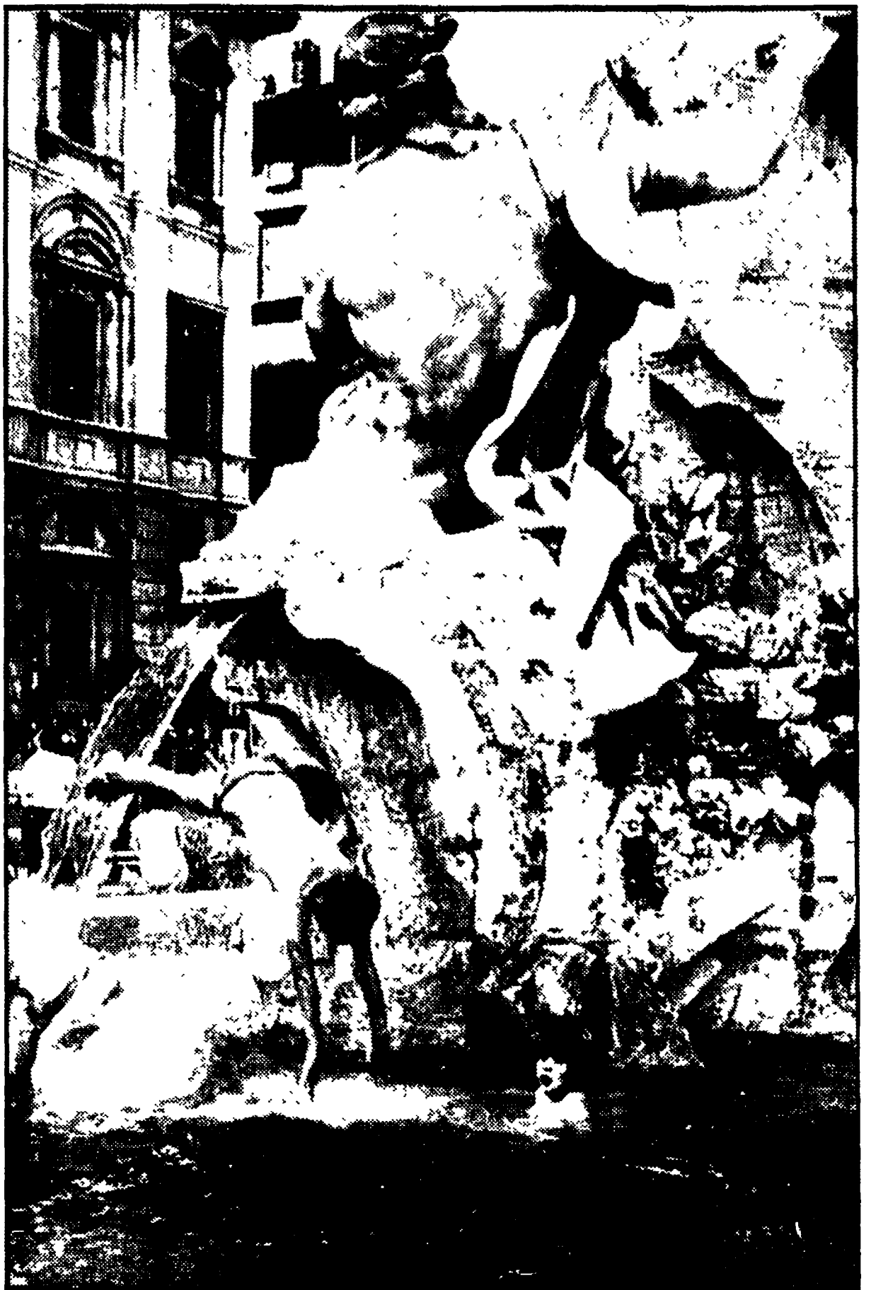
Ragazzini si tuffano nella fontana del Bernini in piazza Navona a Roma.