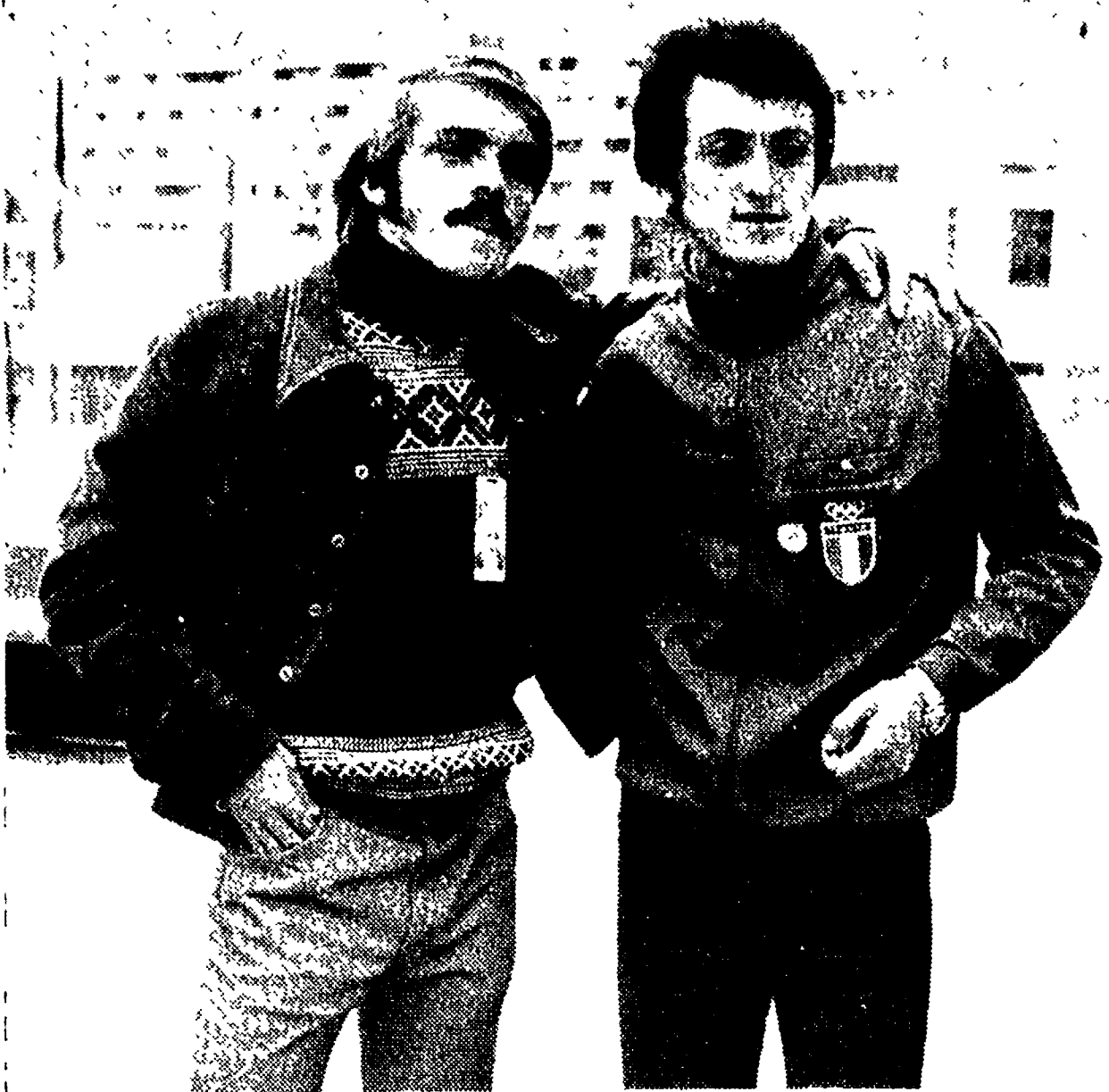
MONACO — Pietro Mennea, l'azzurro dell'atletica su cui poggiano fondate speranze, è qui ritratto con Steve Prefontaine, l'americano favorito nella gara dei cinquemila metri.