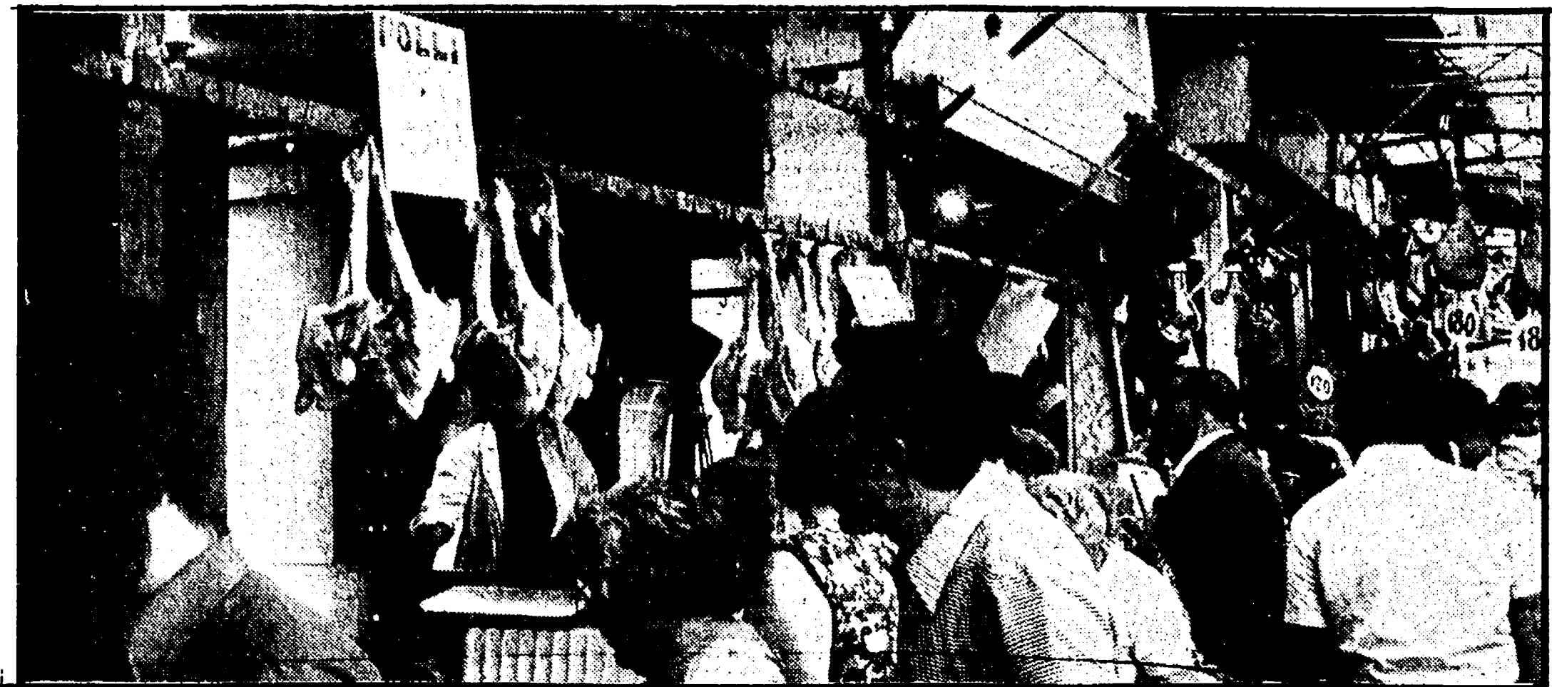
Banchi per la vendita delle carni a piazza Vittorio; la chiusa è stata confermata per domani e martedì

Per due giorni sbarrate le rivendite di carne, frutta, verdura e gli'altri generi alimentari — Rimarranno aperti solo i banchi dell'ente comunale — Presa di posizione della Confesercenti — Incontro unitario tra l'organizzazione democratica dei commercianti ed i rappresentanti delle tre camere del lavoro