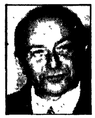
BERTOLDI - Non si sconfigge il conservatorismo d.c. senza le masse popolari

crociato rischia, perciò, di essere vista come un grave accidente transitorio.