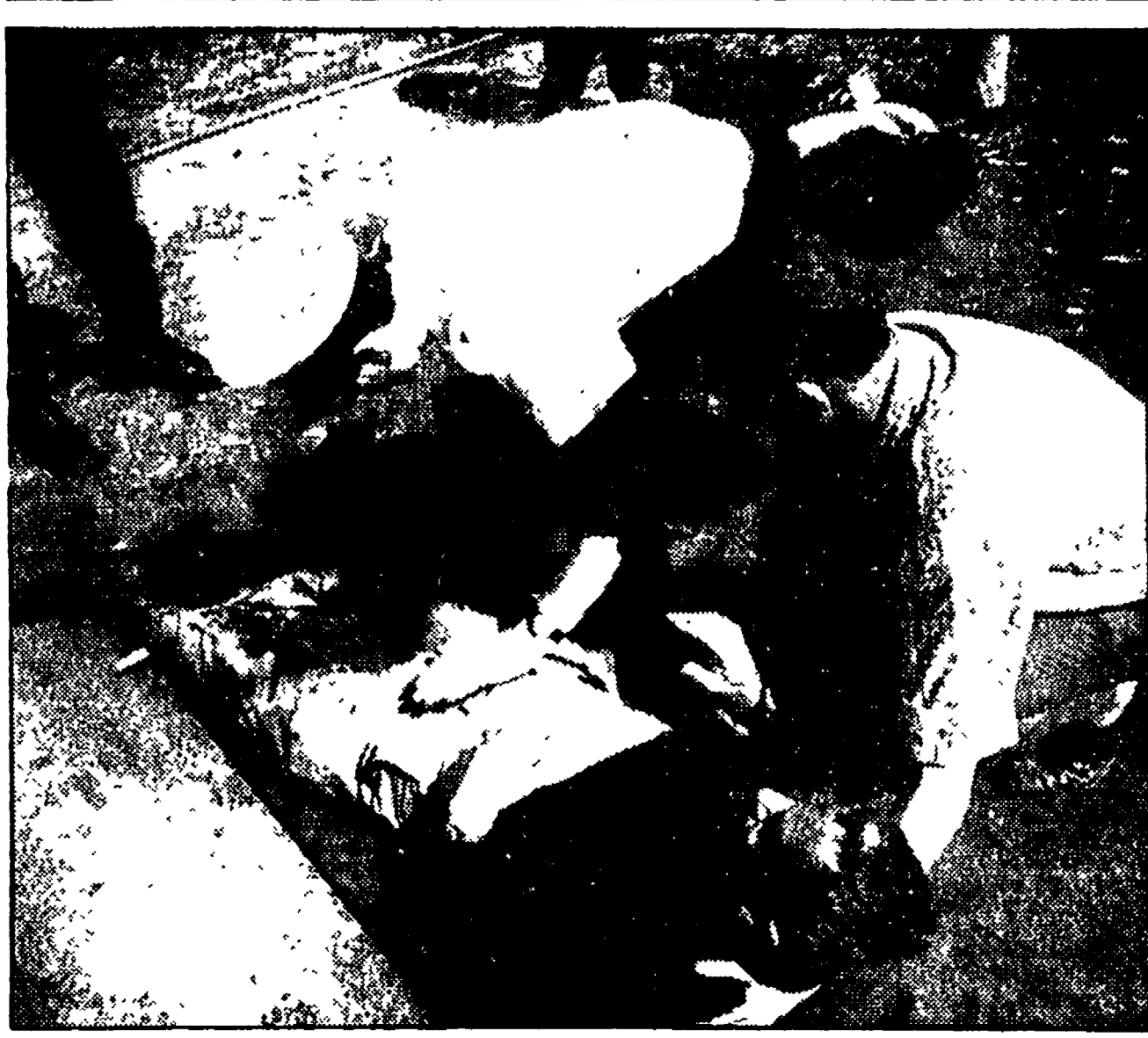
ATTENTATI USTASCIA A SYDNEY - Tre attentati sono stati compiuti contro un'agenzia di viaggi jugoslava, un albergo nel quartiere suburbano di Paddington...