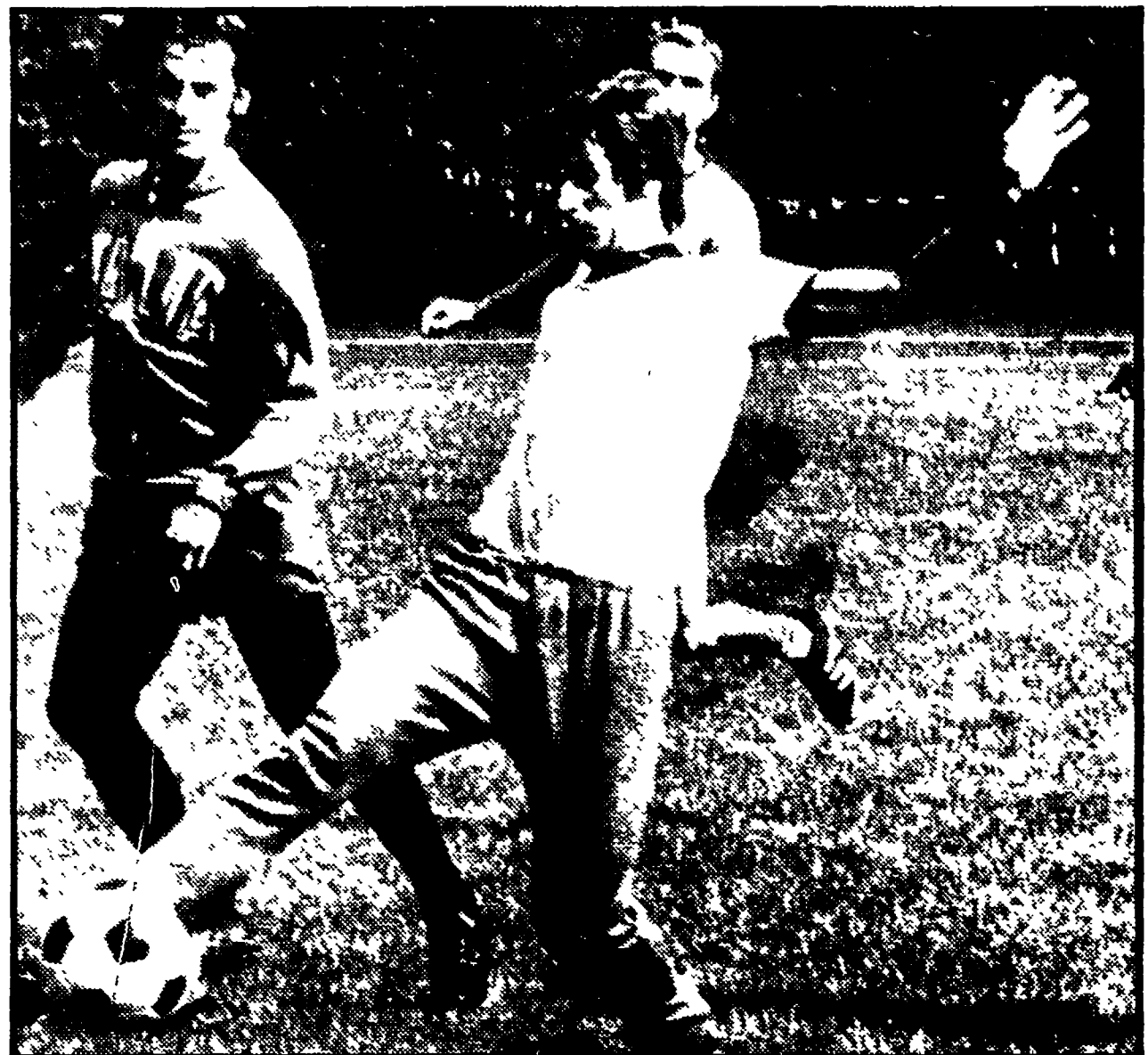
Una foto quasi emblematica: RIVERA a passo di danza è di nuovo alla ribalta della nazionale mettendo in secondo piano il suo rivale MAZZOLA (di cui si intravede la parte superiore della testa). Domani i due si alterneranno in nazionale, ma poi pare che sarà Rivera ad avere la meglio.

Potrebbe anche giocare stopper Spinosi con debutto di Bellugi a terzino