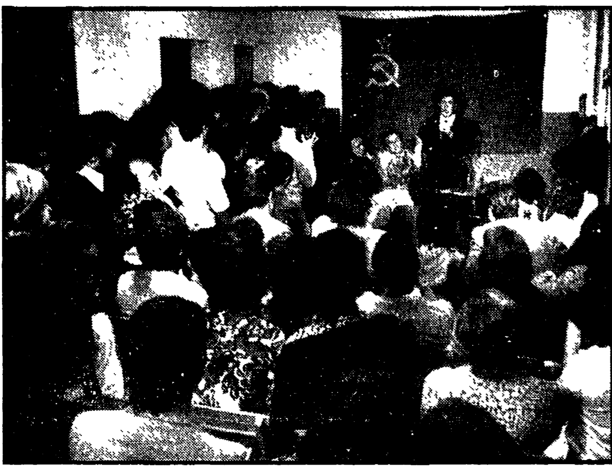
Il compagno Berlinguer mentre parla all'inaugurazione della sezione di Ponte Milvio