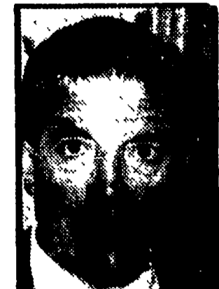
BRANCA - Contrario alla legge del referendum nel '73