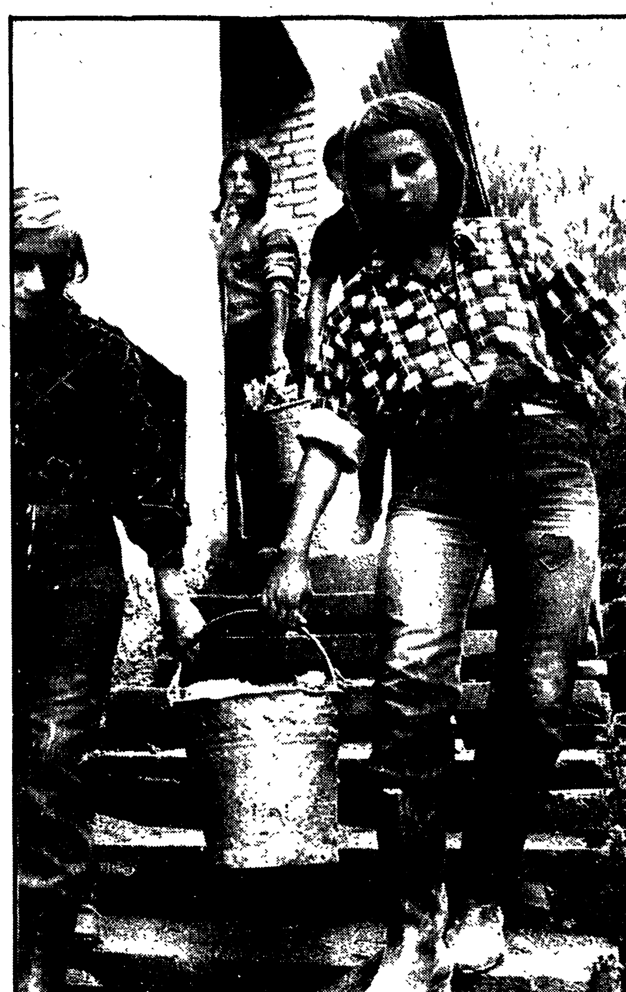
Sotto la guida di tecnici e istruttori provenienti da tutti i paesi socialisti, migliaia di giovani di tutte le regioni della Polonia hanno dedicato una parte delle loro vacanze alla ricostruzione...