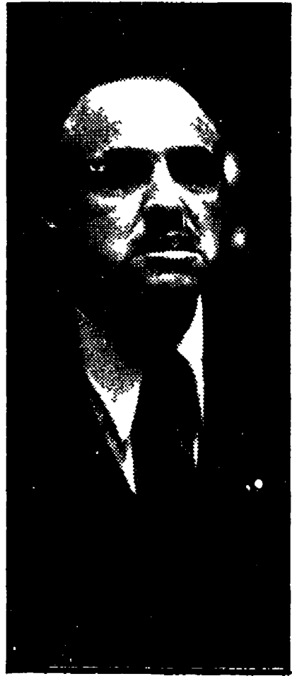
Marlon Brando nel film « Il padrino »