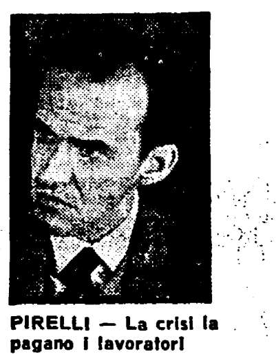
PIRELLI - La crisi la pagano i lavoratori