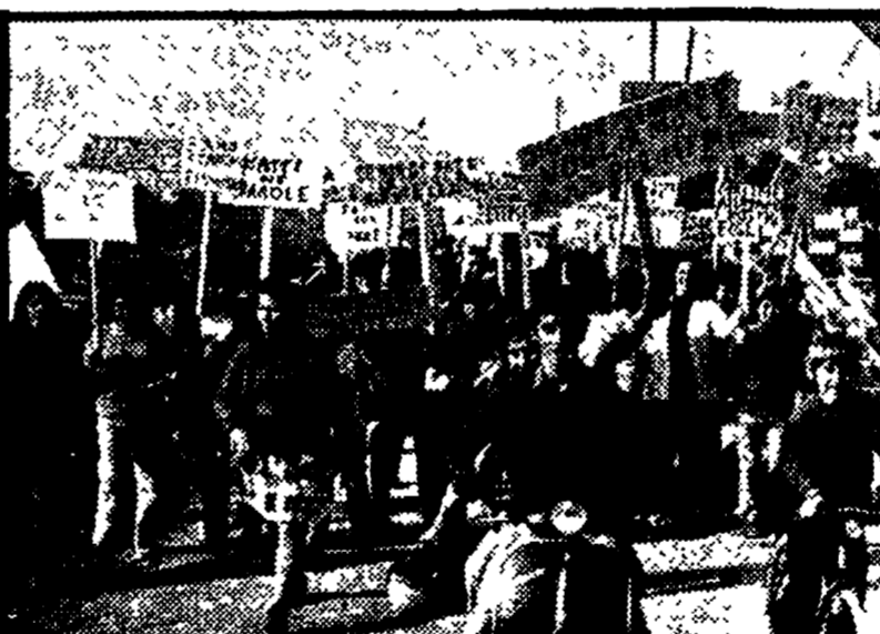
FRASCATI - Domani gli studenti dell'istituto tecnico commerciale Pantaleoni di Frascati terranno un'assemblea nei locali della scuola in segno di protesta per i disagi e le difficoltà incontrate dagli studenti per la mancanza di aule.

EDILI - Sciopero di 4 ore a partire dalle ore 12. I lavoratori edili effettueranno 24 ore di sciopero.