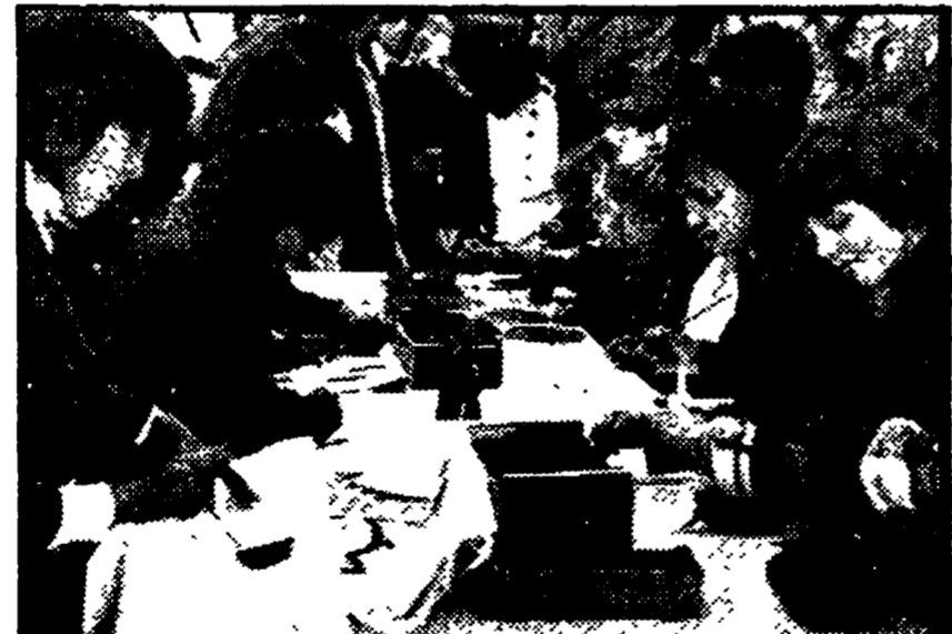
Protagonisti i bambini, impegnati in attività creative di vario tipo, si è svolta nella giornata di sabato e domenica, in piazza Guadalupe a Monte Mario, una manifestazione per la scuola. L'iniziativa ha offerto l'occasione per denunciare le spaventose carenze scolastiche e dimostrare in con-

La situazione ad Anzio, Frascati, Pomezia, Velletri, Marino, Grottaferrata - Vivace protesta a Passoscuro contro i turni pomeridiani