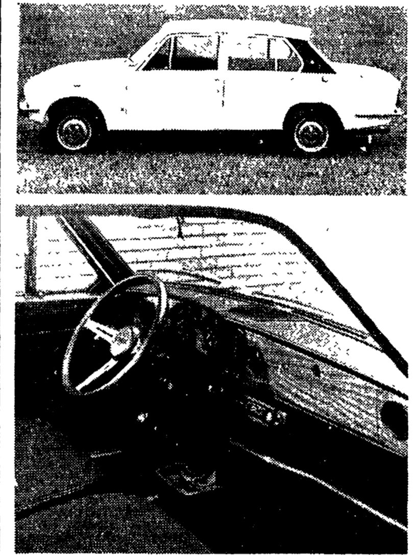
La Triumph «Dolomite» fotografata lateralmente (foto in alto) e (foto qui sopra) in una vista parziale dell'abitacolo. Si nota l'eleganza del cruscotto in noce e il volante imbottito a tre razze. La colonna dello sterzo è regolabile verticalmente e assistita per assicurare la migliore posizione di guida.

Al Salone di Torino sarà presente per la prima volta la Leyland Innocenti, la società nata dopo l'assorbimento della Innocenti nel gruppo British Leyland. La casa si presenta nella doppia veste di produttrice delle autovetture di propria fabbricazione e di programmi preventivi una produzione di 75 mila unità nel 1973 e di distributrice di autovetture di marche famose come la Austin Morris, la Jaguar, la Triumph e la Rover.